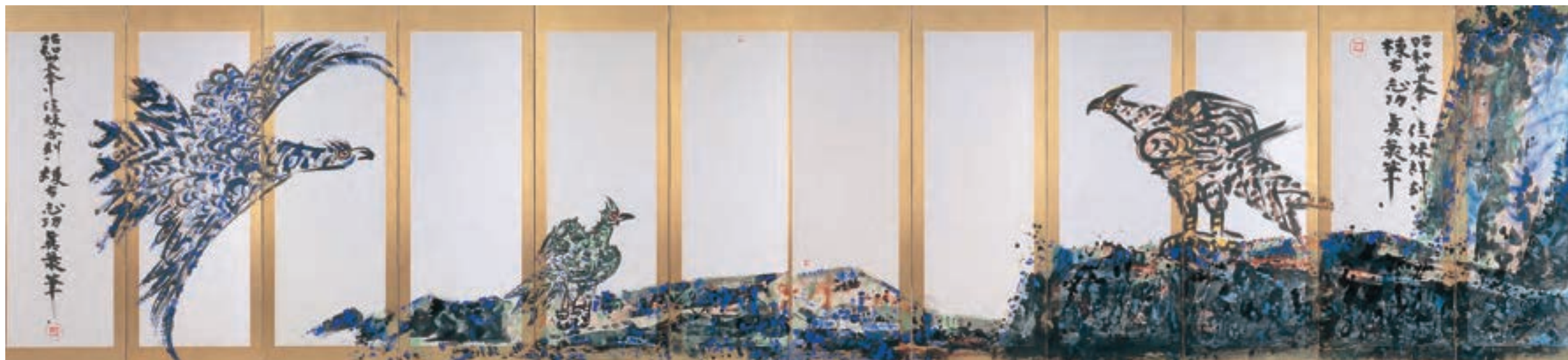
《御鷹々々図》倭画 1960年 当館寄託