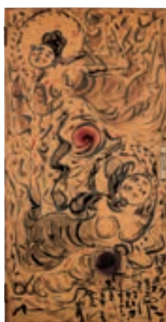
《板戸絵 天女図》倭画 1965年(前期展示)※