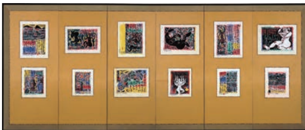
《焔火頌》板画 1950～1965年(1969年発表) 当館蔵