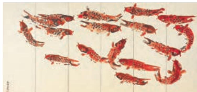
《御群鯉図》倭画 1940年(後期展示)