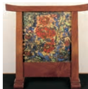
《衝立 牡丹図》倭画 1965年(前期展示)※