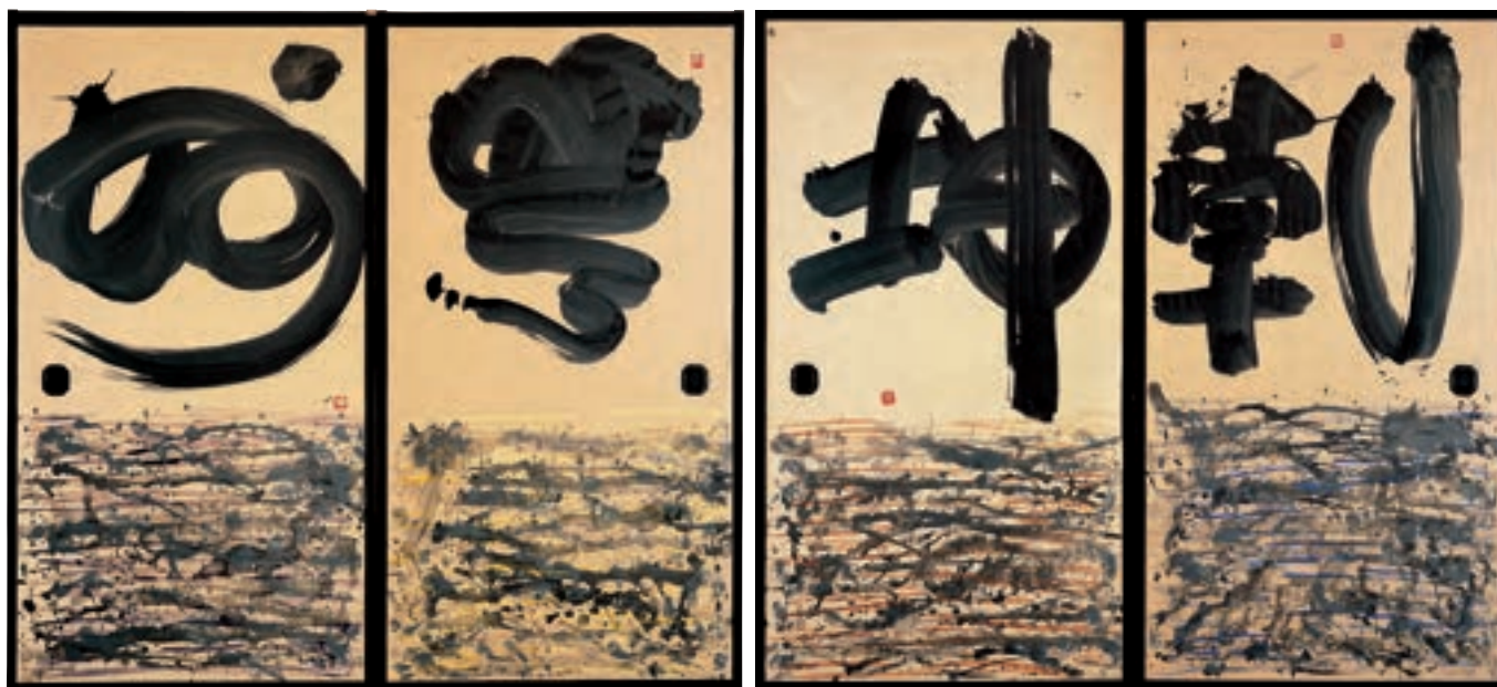
《乾坤無妙》倭画 1965年(前期展示)※

※京都の山口邸に描いた肉筆画は前期のみ、倉敷の大原邸に描いた《御群鯉図》は後期のみの展示です。