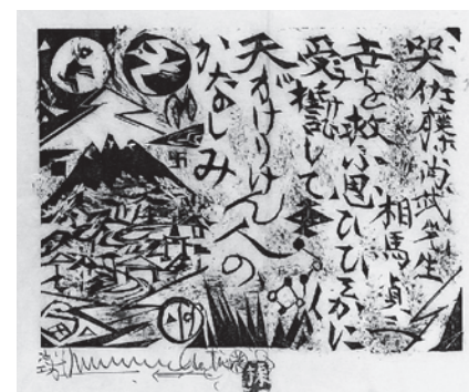
《尚武頌A》板画 1973年 当館蔵